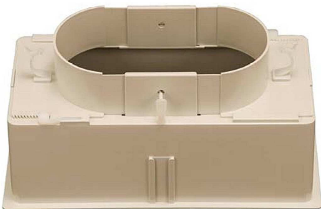
Sistema di regolazione stacco